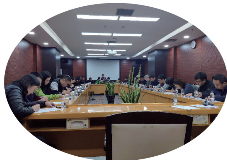
2019年10月末，国家统计局第8统计督察组在辽宁开展防范和惩治统计造假、弄虚作假督察工作，铁西区为受检县区，图为督察组与区领导见面会。