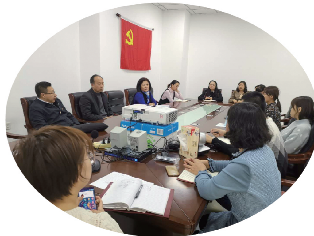
2019年2月21日，铁西区统计局党支部召开党员大会，进行支部换届选举。