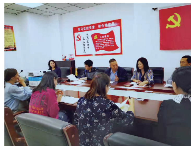
2019年9月23日，铁西区统计局党组以理论学习中心组集中学习的形式组织开展“不忘初心、牢记使命”主题教育学习研讨。