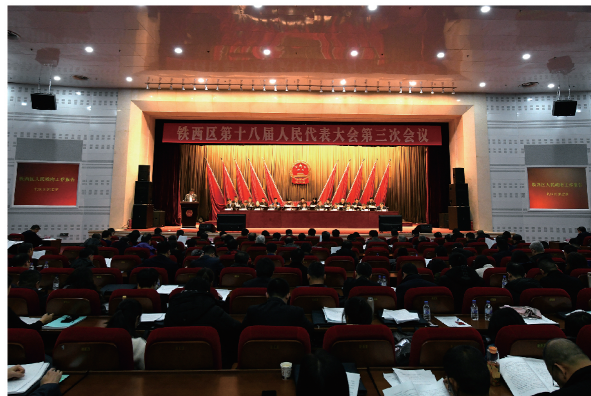
铁西区第十八届人民代表大会第三次会议

主 编 王林祥 副 主 编 程凤芹 李东植 应 麒 编辑人员 (按姓氏笔画排序) 马鑫玲 宁 澈 刘方园 刘彦君 关霜莹 孙 建 孙 新 李菲萍 李敬华 李珊珊 李 娜 杨文娟 杨 焯 杨 爽 吴剑侠 邱 天 张 晗 张君玲 郑冬丽 赵 英 袁 松 徐晓丽 海波 鲁 妍 李佳书 关霜莹 罗 龙 尹 航 徐晓丽 版面编辑 张 晗 吴剑侠 赵 威