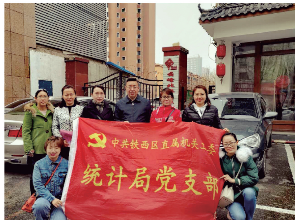
2019年4月13日，铁西区统计局支部党员到云峰北社区参加义务劳动，向企业及居民发放创城宣传资料。