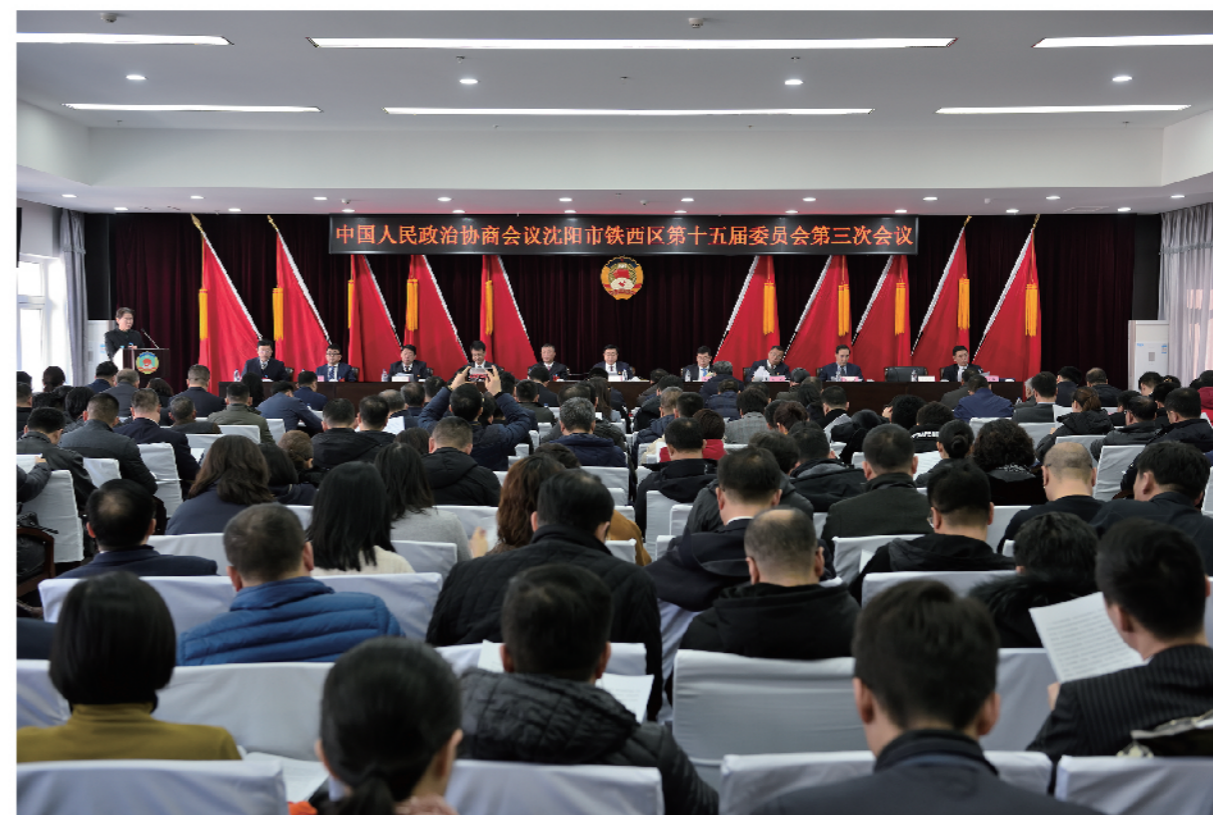
中国人民政治协商会议沈阳市铁西区第十五届委员会第三次会议