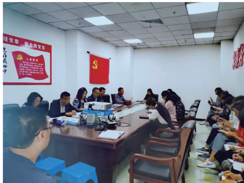
2019年9月18日，铁西区统计局召开“不忘初心、牢记使命”主题教育动员部署会。