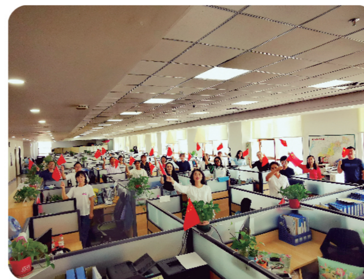
2019年9月30日，铁西区统计局全体干部职工共同歌唱祖国，庆祝新中国成立70周年华诞。