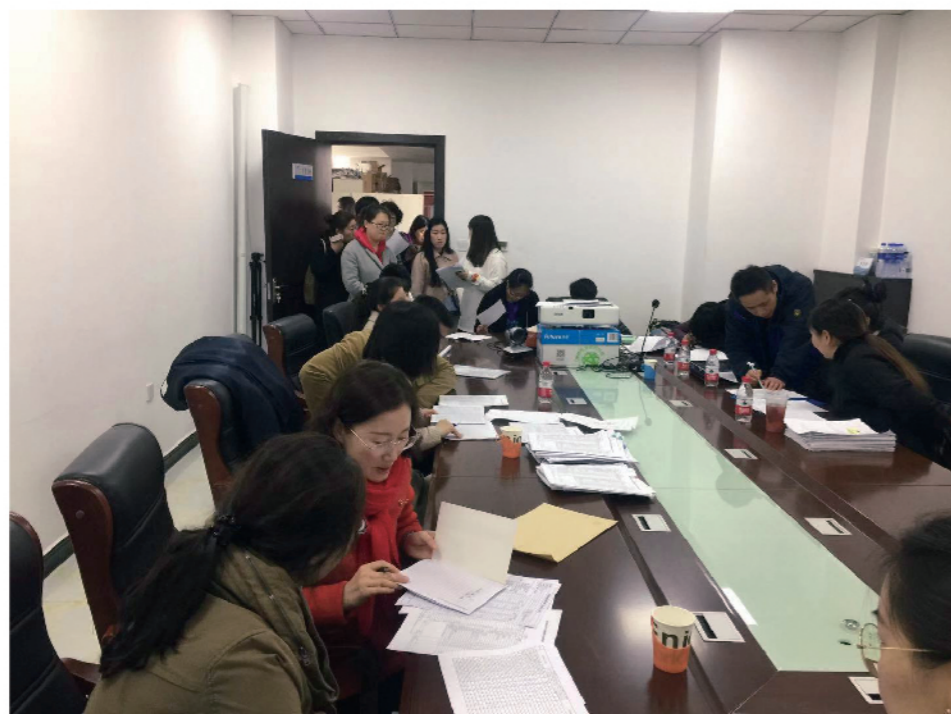
2019年3月15日，市统计局投资处一行3人，对我区百余家建筑业企业的财务数据进行审核，指导企业对主要经济指标进行核实。