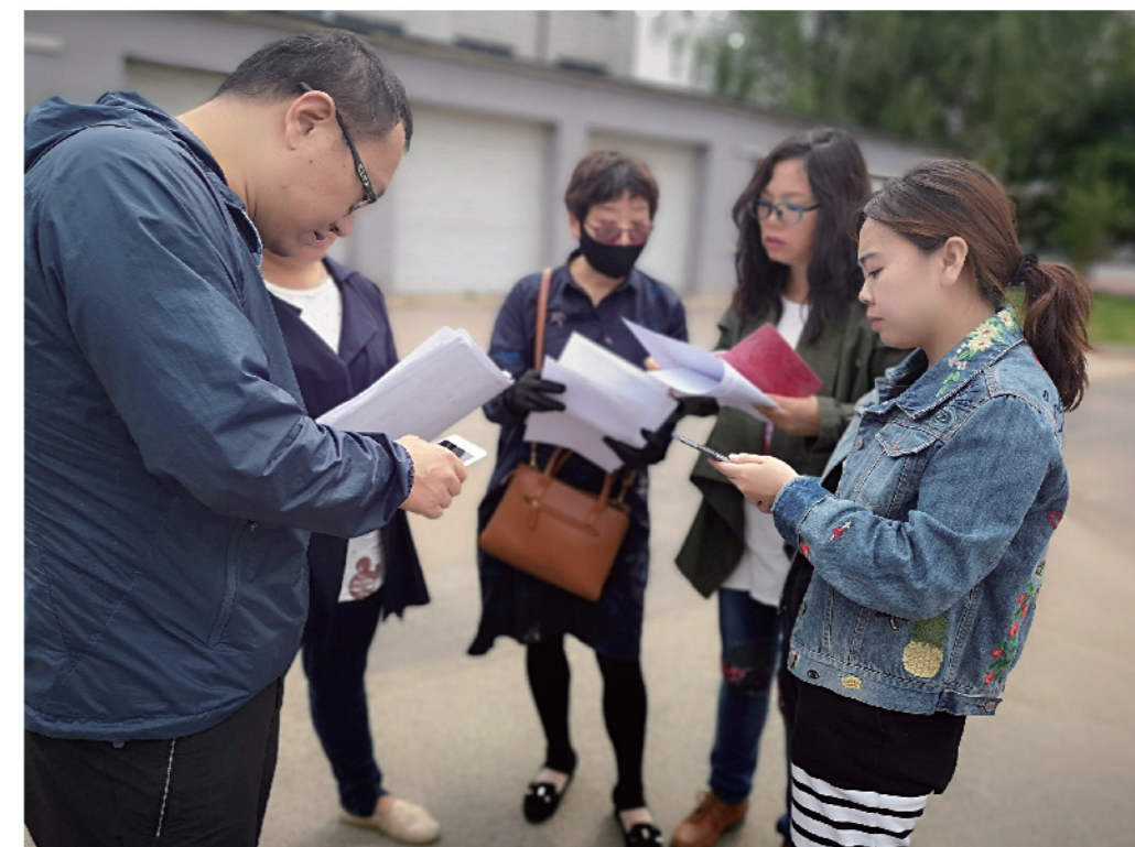
2019年5月30日，铁西区统计局开展区级四经普数据质量抽查。图为抽查组在企业实地开展普查数据核查，并将数据录入PDA。