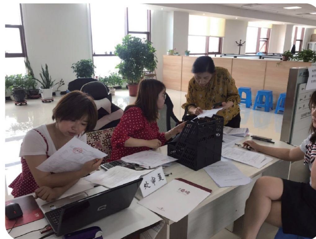
2019年6月5日，铁西区统计局针对物业企业开展普查数据审核。