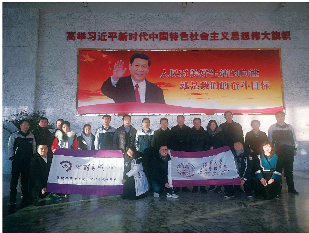
2019年11月24日，清华大学公管学院调研组一行15人，到我区调研企业经营发展情况。

2019年7月16日，辽宁省统计局贸易外经处宋建群副处长深入我区乐淘汽车等四家汽车销售企业进行调研。