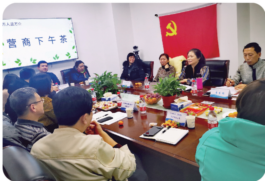
2019年12月24日，铁西区统计局邀请部分企业代表茶话建言。