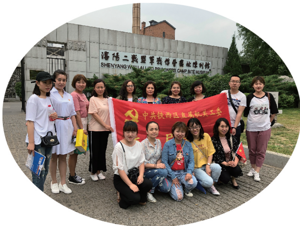
2019年6月28日，铁西区统计局党支部参观二战盟军战俘营遗址陈列馆。