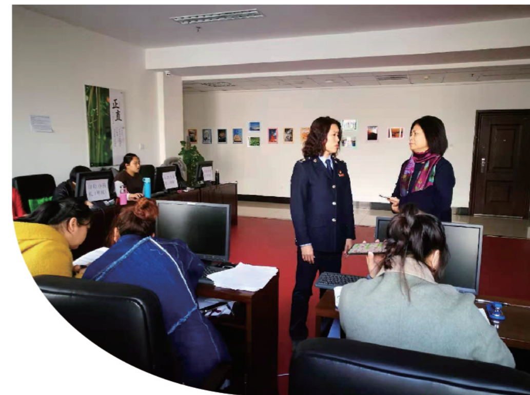
2019年3月11日至22日，铁西区经普办联合两区税务局，组织尚未完成经普登记的企业到税务局进行集中填报。