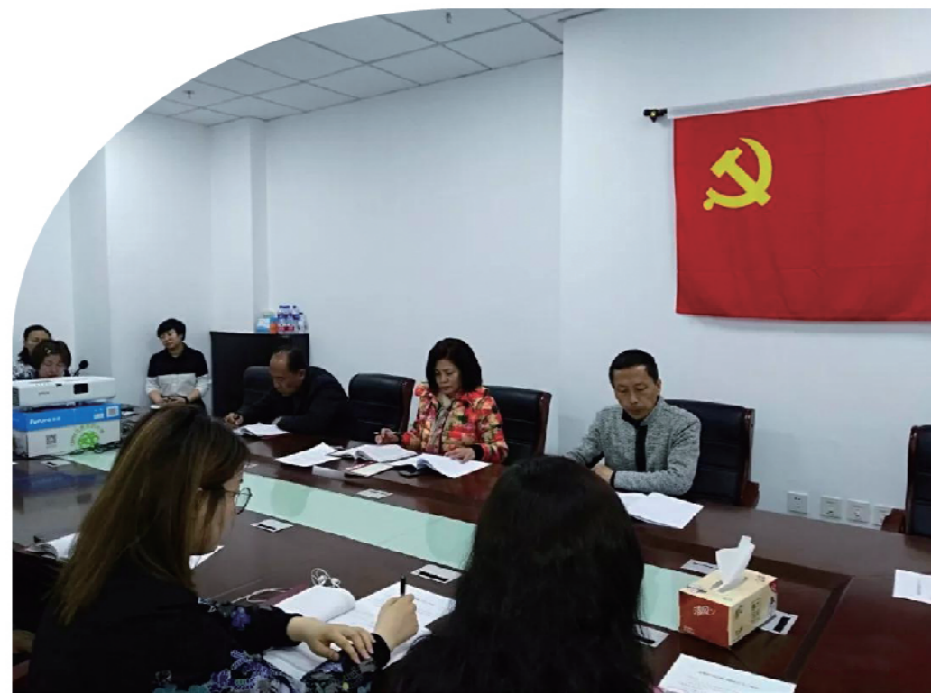
2019年4月3日，铁西区统计局召开违规使用经费专项检查工作传达部署会和工作纪律检查工作会，全体工作人员参会。