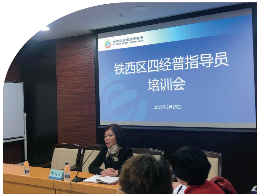
2019年2月15日，铁西区召开第四次全国经济普查指导员业务培训会。