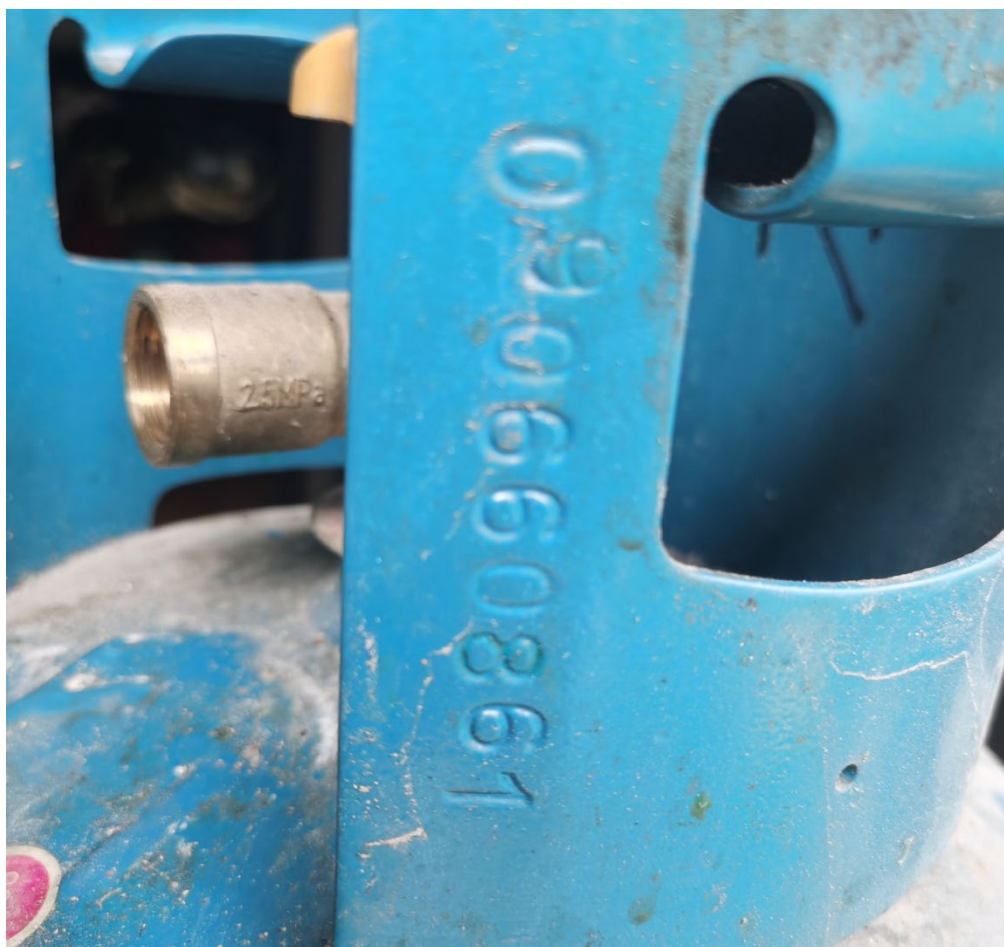
钢瓶 2 钢印标志