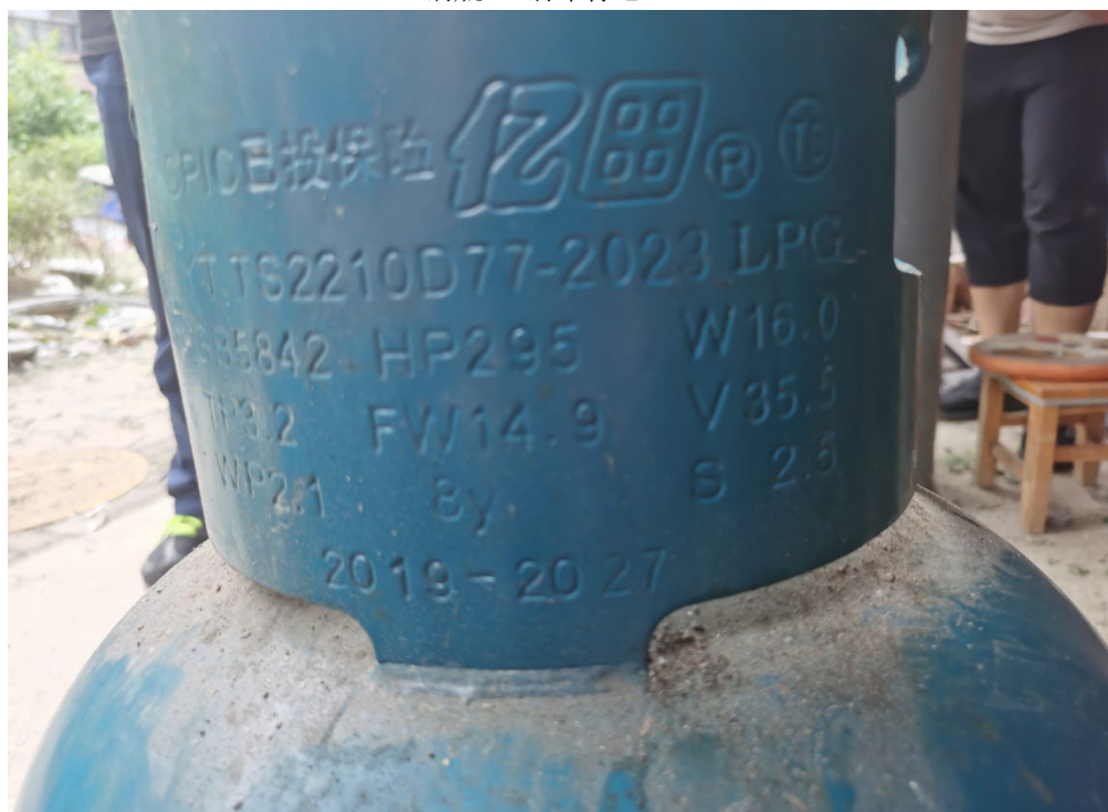
钢瓶 2 钢印标志