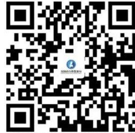
市自然资源局经开分局权力事项清单