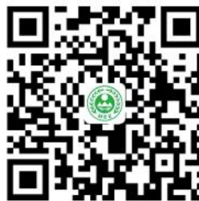
“首违不罚”事项清单

对当事人两年内首次发生清单中所列事项且危害后果轻微，在生态环境执法部门发现前主动改正或者在责令改正后立即改正的，不予行政处罚。