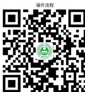
26. 对土壤环境污染重点监管单位储存有毒有害物质的地下储罐信息备案

② 网上办： 沈阳政务服务网： http://zwfw.shenyang.gov.cn/