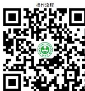
23. 环境影响后评价备案

② 网上办 ：沈阳政务服务网： http://zwfw.shenyang.gov.cn/