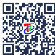
操作流程-学生资助