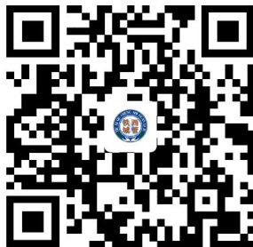
城市建筑垃圾处置核准