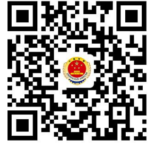
检察服务权力事项清单