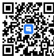
6. 宗教活动场所变更审批