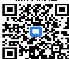
7. 宗教活动场所终止审批