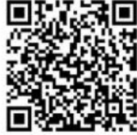
政务服务大厅地图导航