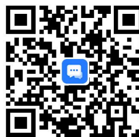
民宗局违规禁办事项清单