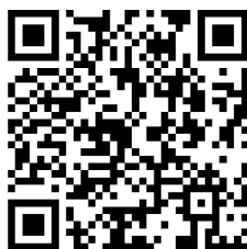
6. 残疾类别/等级变更