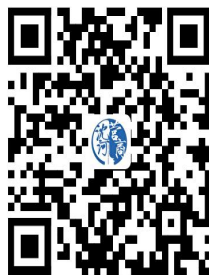
42.申报从未就业人员独生子女退休补助费操作流程

② 网上办 ：沈阳市政务服务网 http://zwfw.shenyang.gov.cn/