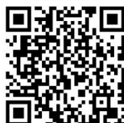
21.国家免费孕前优生健康检查项目服务卡