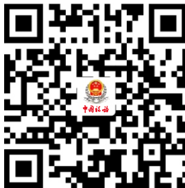
23.城乡居民社会保险费申报缴费