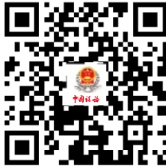
25.文化事业建设费申报