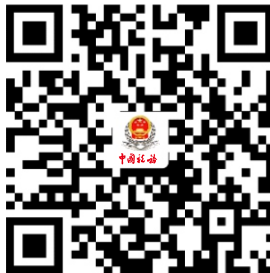
19.开具税收完税证明