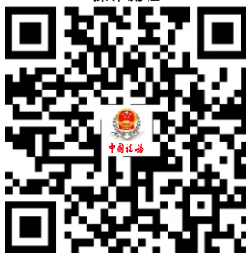
11.增值税小规模纳税人申报