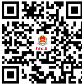
5.增值税一般纳税人登记