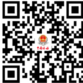
18.申报享受税收减免