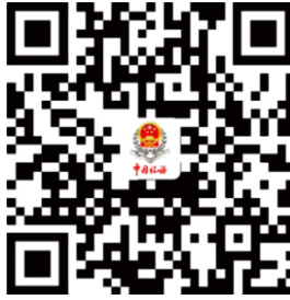
“免申即享”事项清单