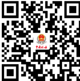
22.灵活就业人员社会保险费申报缴费