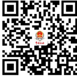
附报资料事项清单