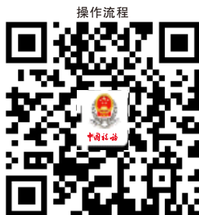
34.纳税人涉税信息查询