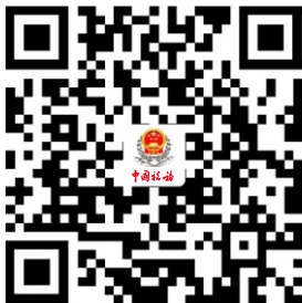
21.单位社会保险费申报