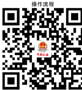
29.居民综合所得个人所得税年度自行申报