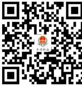
15.城镇土地使用税申报