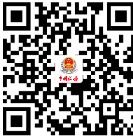
8.代开增值税专用发票