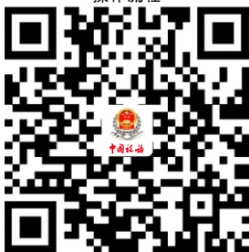
24.残疾人就业保障金申报