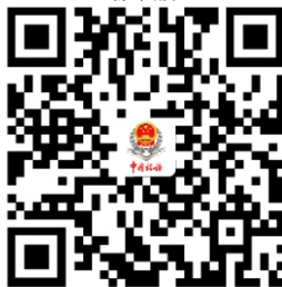
6.增值税专用发票(增值税税控系统) 最高开票限额审批