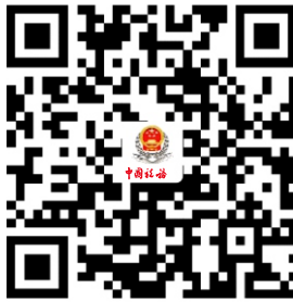
17. 房地产交易税费申报