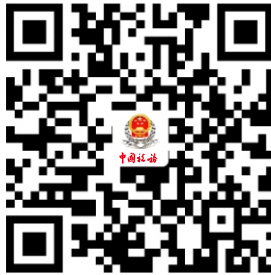
28.非居民企业企业所得税预缴申报