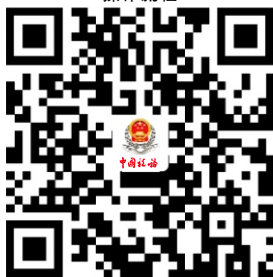
10.增值税一般纳税人申报