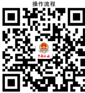
30.经营所得个人所得税年度申报