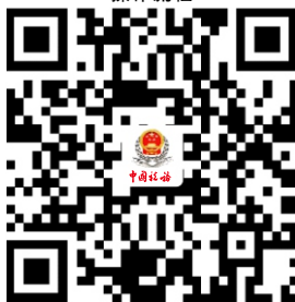
9.代开增值税普通发票