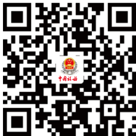
1.一照一码户/个体工商户信息确认