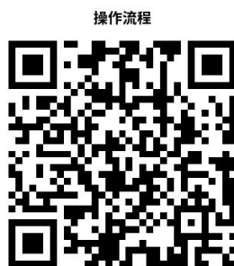
机动车检验合格标志核发

③ 一站办 ：已授权的 81 家检车线可办理需上线检车的车辆的检验合格标志核发业务