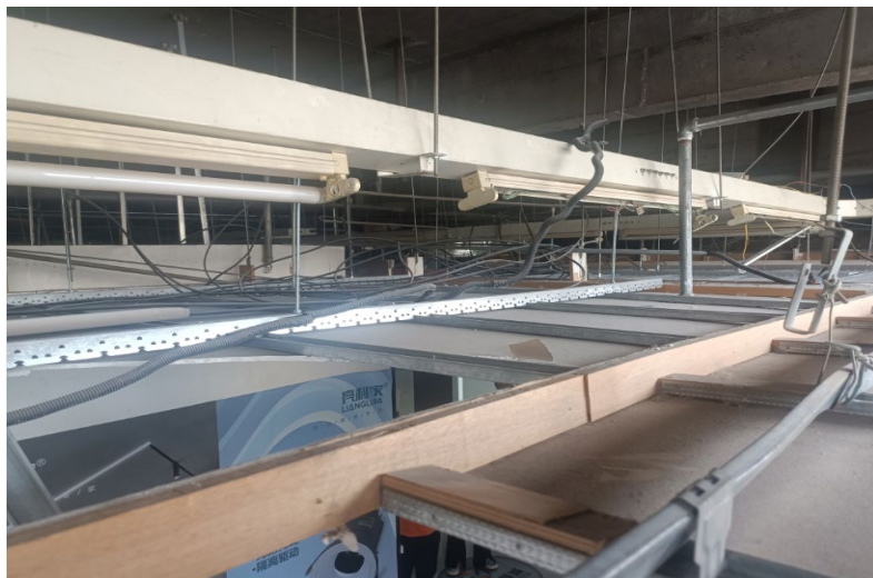
图 5 吊顶夹层内导体分布状态